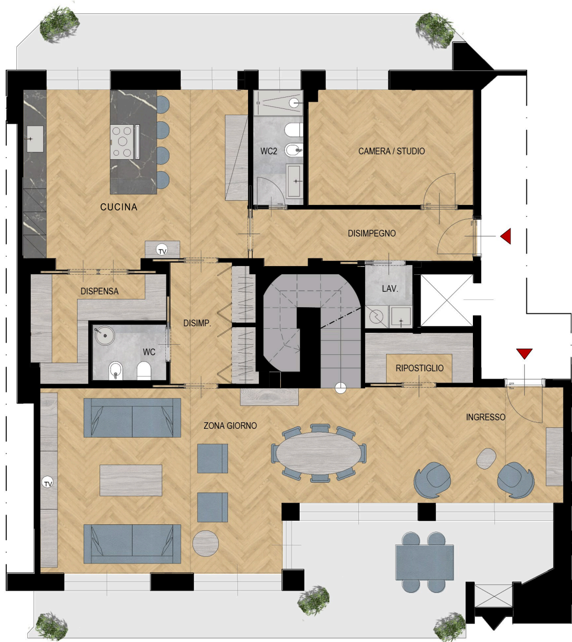
VIA ALFONSO LAMARMORA