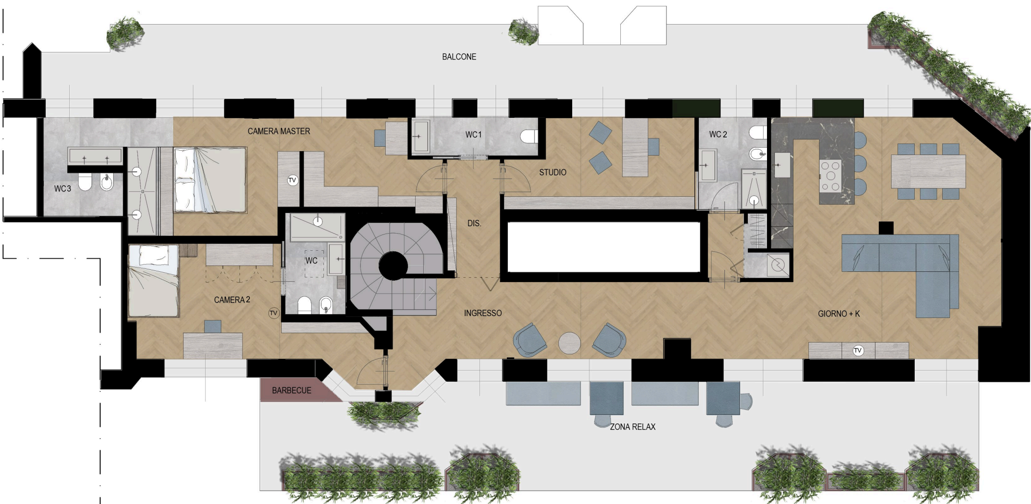
VIA ALFONSO LAMARMORA

Il progetto è da intendersi indicativo e preliminare A norma di legge il presente disegno non potrà essere riprodotto né consegnato a terzi né utilizzato per scopi diversi da quello di destinazione senza l'autorizzazione scritta del progettista che ne detiene la proprietà