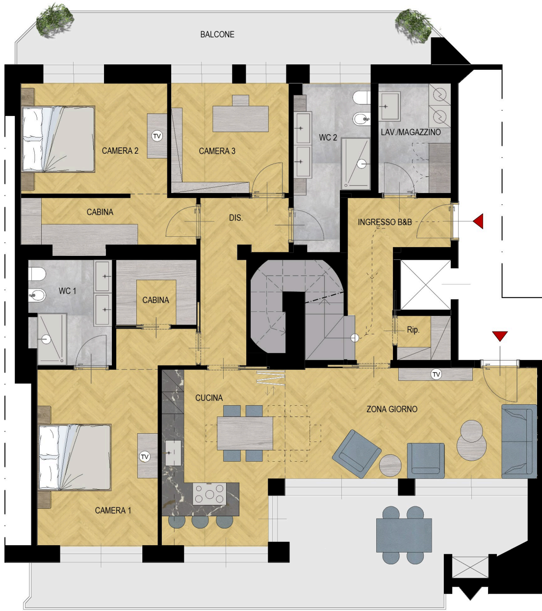
VIA ALFONSO LAMARMORA