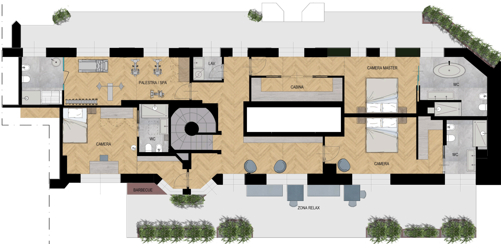
VIA ALFONSO LAMARMORA

Il progetto è da intendersi indicativo e preliminare A norma di legge il presente disegno non potrà essere riprodotto né consegnato a terzi né utilizzato per scopi diversi da quello di destinazione senza l'autorizzazione scritta del progettista che ne detiene la proprietà