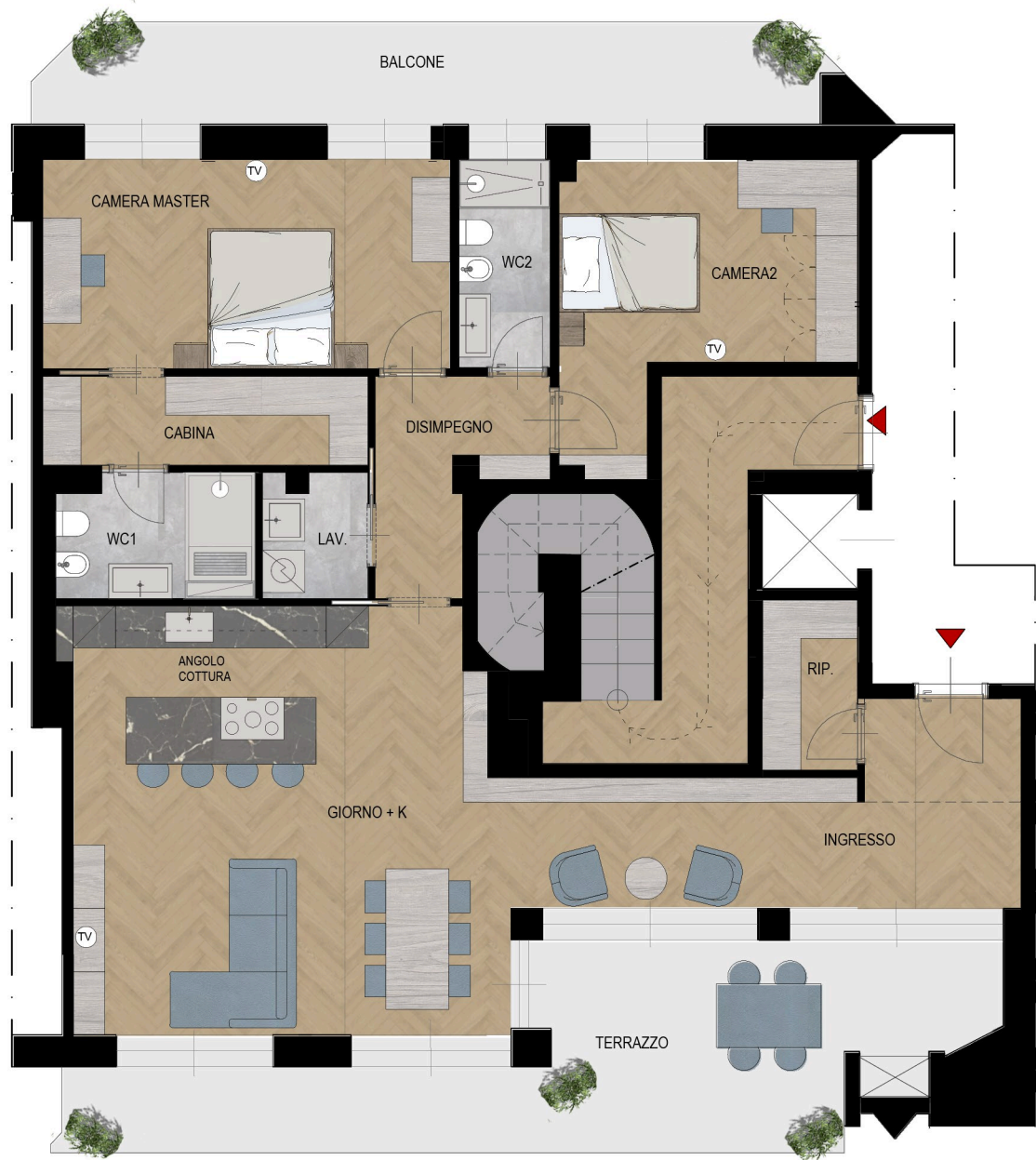
VIA ALFONSO LAMARMORA